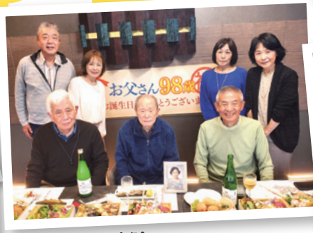
親戚一同集まり楽しい食事会