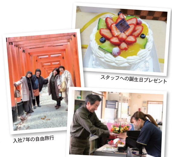
スタッフへの誕生日プレゼント

四季折々の花。ありがとうの創業時より、施設内には心を込めて生けたお花がいっぱいです。ご利用者を想うありがとう自慢の“お花”たちです。 ※20年ずっとお花を持ってきてくださるボランティアの皆さんに支えられています。