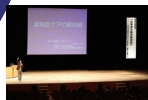
市民公開講座 毎年市民向けの講座を開催! 認知症サポーターも開催