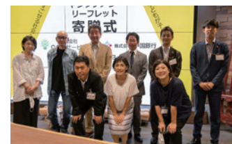
「ヤングケアラー」のリーフレットを配布 市内や小中学校にパンフ配布(福山市とコラボ)