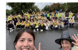
春日池オアタムフェス 市とともに地域の中でイベント主催。参加者1,300人!!