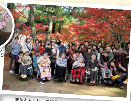
家族とともに一泊旅行！

色々な活動と行き届いた温かいお世話を頂き、家族一同心から感謝しております。おかげさまで母は日々元気になっています！