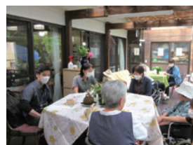
認知症カフェ 月に2回定期開催