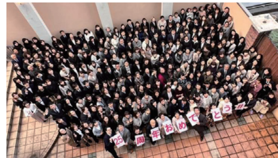
ありがとう20周年記念パーティより