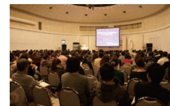
学会主催・介護スクール 毎年福山で中〜大規模の学会開催。地域経済に貢献、地域介護職の学びに貢献