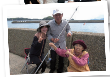
もう1回家族と海釣りに行きたいを実現