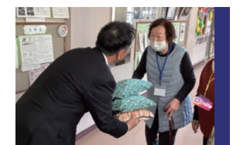
利用者による地域貢献プログラム デイ・グループホームのご利用者がボランティア活動をしています